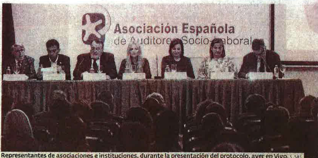
Representantes de asociaciones e instituciones, durante la presentación del protocolo, ayer en Vigo. S. SAS