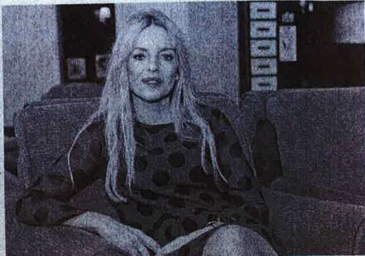
Ángeles Carmona preside el Observatorio de Violencia Doméstica y de Género. RODRIGO UTERO

—No, aunque es verdad que la Ley de Igualdad del 2007 se ha traducido en pasos adelante enormes y que en el ámbito de la empresa se ve mucha sensibilidad. Estamos muy contentos de ver la respuesta tan abrumadora que ha tenido la adhesión al protocolo en Galicia: se han adherido 150 empresas tanto del ámbito privado como público, tanto grandes como pequeñas. Y municipios, algo muy importante, porque la ruralidad es un factor de especial vulnerabilidad: la mayor parte de las víctimas de violencia de género se